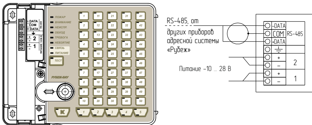
Рисунок 1 - Внешний вид и способ подключения прибора