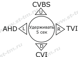
Рис.3 Схема переключения стандартов видеосигнала

ВНИМАНИЕ! При подключении питающего напряжения 12 Вольт к видеокамере соблюдайте полярность.