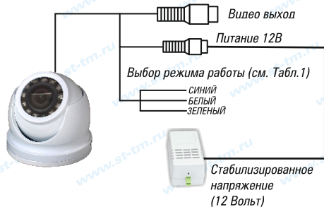
Рис.1 Схема подключения