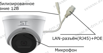
Рис.1 Схема подключения видеокмеры