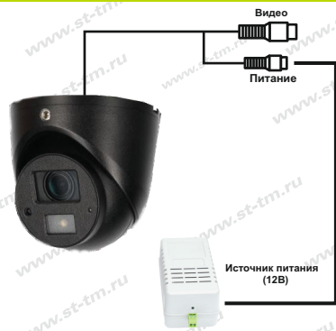
Рис.1 Схема подключения