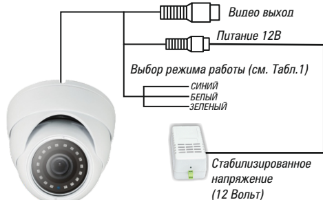
Рис.1 Схема подключения