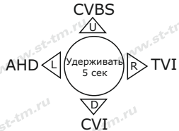
Рис.3 Схема переключения стандартов видеосигнала

ВНИМАНИЕ! При подключении питающего напряжения 12 Вольт к видеокамере соблюдайте полярность.